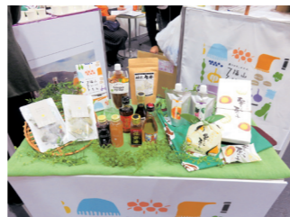
3社1団体が約20商品を出展