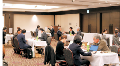
バイヤーに商品をPR