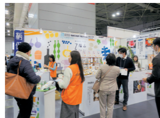
来場者に商品を説明