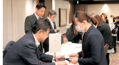
商談前の名刺交換

バイヤーからは「非常に魅力的な商品が多く、地元福山の商品を販売してみたい」などの声がありました。また事業者からは「売り場の動向・売れ筋など直接聞くことができた」など好評でした。参加事業者27社・69商談。