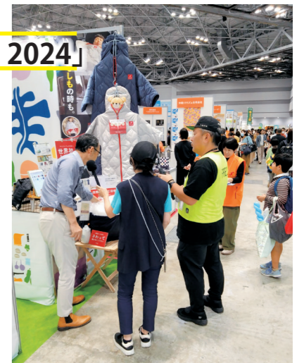
商品の特徴について説明する出展事業者

出展事業者は、来場者に商品を触ってもらったり試飲をしてもらいながら、自社商品の特徴やサービスについて熱心に伝え、一般消費者への販売やバイヤーとの商談などを行いました。出展事業者5社。