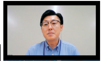
今年度の事業概要などをオンラインにて説明